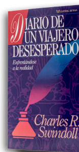
Diario de un Viajero Desesperado por Charles R. Swindoll Libro tapa blanda