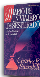
Diario de un Viajero Desesperado por Charles R. Swindoll Libro tapa blanda