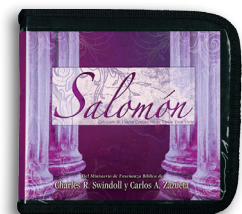
Salomón por Charles R. Swindoll y Carlos A. Zazueta Mensajes en CD/MP3

Para más recursos, por favor llame: 1-800-898-4847 o 1-469-535-8433