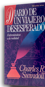
Diario de un Viajero Desesperado por Charles R. Swindoll Libro tapa blanda