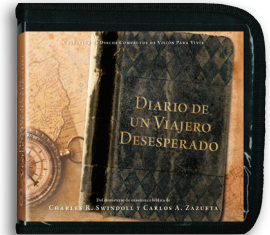
Diario de un Viajero Desesperado por Charles R. Swindoll y Carlos A. Zazueta Mensajes en CD/MP3