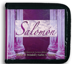
Salomón por Charles R. Swindoll y Carlos A. Zazueta Mensajes en CD/MP3

Para más recursos, por favor llame: 1-800-898-4847 o 1-469-535-8433