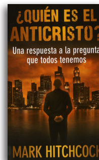
¿Quién es el Anticristo? por Mark Hitchcock Libro en tapa blanda