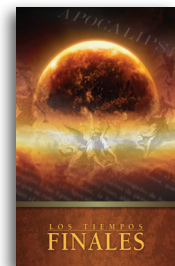
Los Tiempos Finales por Charles R. Swindoll Librito en tapa blanda

Para más recursos, por favor llame: 1-800-898-4847 o 1-469-535-8433