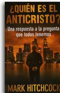
¿Quién es el Anticristo? por Mark Hitchcock Libro en tapa blanda