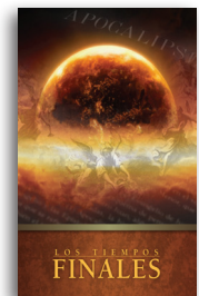
Los Tiempos Finales por Charles R. Swindoll Librito en tapa blanda

Para más recursos, por favor llame: 1-800-898-4847 o 1-469-535-8433