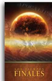
Los Tiempos Finales por Charles R. Swindoll Librito en tapa blanda

Para más recursos, por favor llame: 1-800-898-4847 o 1-469-535-8433