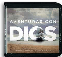
Aventuras con Dios por Charles R. Swindoll y Carlos A. Zazueta 6 Mensajes en CD/MP3