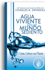
Agua Viviente para un Mundo Sediento por Charles R. Swindoll Libro en tapa blanda

Para más recursos, por favor llame: 1-800-898-4847 o 1-469-535-8433