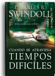
Cuando se Atraviesa Tiempos Difíciles por Charles R. Swindoll Libro tapa blanda

Para más recursos, por favor llame: 1-800-898-4847 o 1-469-535-8433