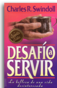
Desafío a Servir por Charles R. Swindoll Libro tapa blanda