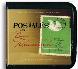
Postales del Nuevo Testamento por Charles R. Swindoll y Carlos A. Zazueta Mensajes en CD/MP3

Para más recursos, por favor llame: 1-800-898-4847 o 1-469-535-8433