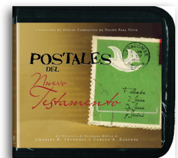
Postales del Nuevo Testamento por Charles R. Swindoll y Carlos A. Zazueta Mensajes en CD/MP3

Para más recursos, por favor llame: 1-800-898-4847 o 1-469-535-8433