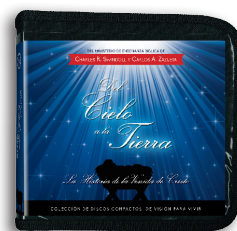
Del Cielo a la Tierra por Charles R. Swindoll y Carlos A. Zazueta Mensajes en CD/MP3

Para más recursos, por favor llame: 1-800-898-4847 o 1-469-535-8433