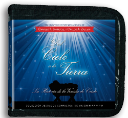
Del Cielo a la Tierra por Charles R. Swindoll y Carlos A. Zazueta Mensajes en CD/MP3

Para más recursos, por favor llame: 1-800-898-4847 o 1-469-535-8433