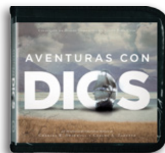
Aventuras con Dios por Charles R. Swindoll y Carlos A. Zazueta 6 Mensajes en CD/MP3